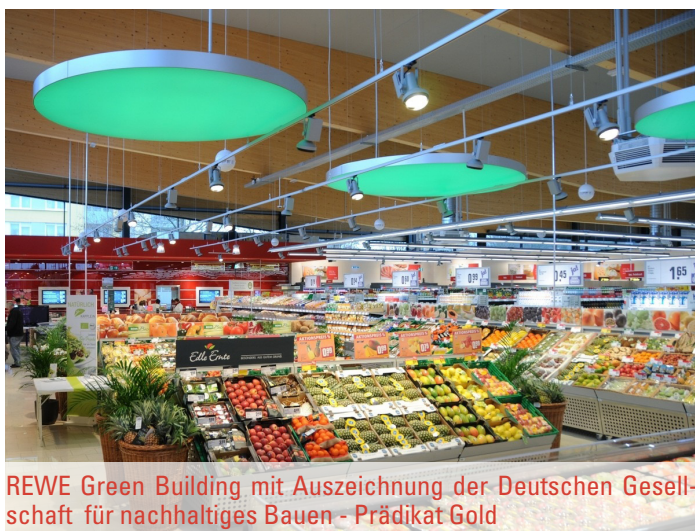
REWE Green Building mit Auszeichnung der Deutschen Gesellschaft für nachhaltiges Bauen - Prädikat Gold

Zu Beginn des Jahres 2023 stieg der Wochenumsatz der Lebensmittler mit einer Verkaufsfläche von mindestens 100 qm von wöchentlich durchschnittlich ca. EUR 2,9 Mrd. (Ende Dezember 2022)