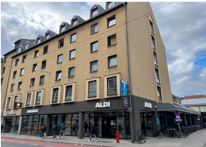
FIM-Markt Erlangen, an Aldi für 15 Jahre neu vermietet, Eröffnung März 2023