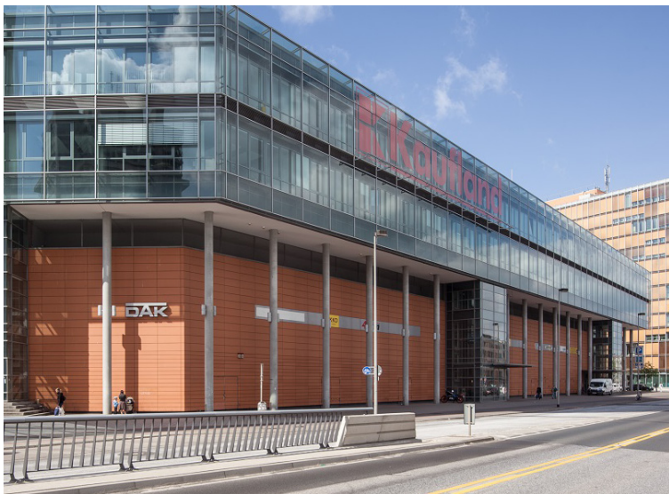
FIM-Markt Hannover: hohe Flächenproduktivität, sehr begehrte Immobilie. Allein in diesem Markt liegt eine schnell liquidierbare stille Reserve in 8-stelliger Höhe.

Im Bonitätsranking der Hamburger Creditreform nimmt das FIM-Rating eine Top-Platzierung ein (Ausfallwahrscheinlichkeit = Bonitätsindex, der das Insolvenzrisiko eines Unternehmens misst). Dem Rang nach etwa auf dem Niveau der Deutschen Post. Das bedeutet, dass die mit 0,02 % bewertete Ausfallwahrscheinlichkeit des Bamberger Unternehmens (höchste Bewertungsklasse unter 6 Stufen) ein ähnlich geringes Ausfallrisiko aufweist wie große Handelsunternehmen/Banken wie EDEKA (A-, Euler Hermes), Rewe (BBB-