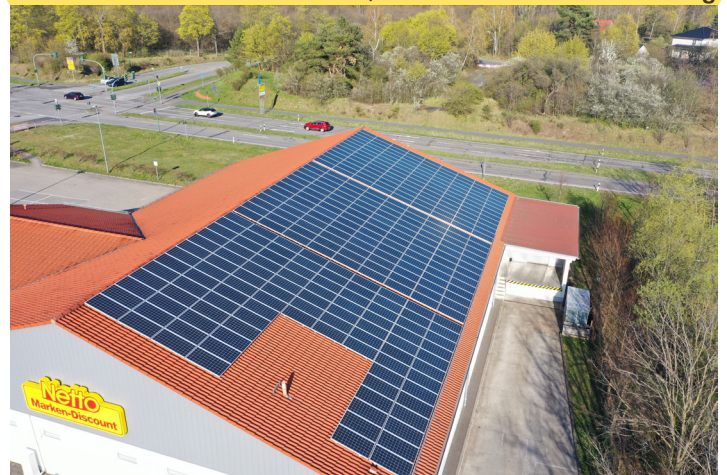
Standort Königswusterhausen: FIM Solardachanlage mit ertragreichen Stromerlösen

FIM ist wie ein Familienunternehmen strukturiert. 3 Familienmitglieder des Gesellschafters wirken in dem Unternehmen mit (Bruder: Bereichsleitung