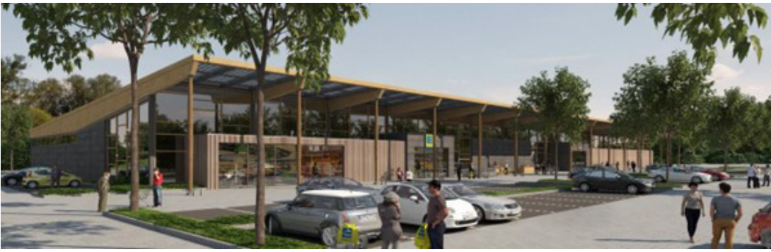
FIM Projektentwicklung Krefeld, Beispiel für zeitgemäße Architektur und Energieeffizienz

Saisonartikel oder Preisaktionen zum Gang in den Markt. Laut BBE Handelsberatung bleibt der stationäre Handel mit Abstand der wichtigste Kanal für die Nahversorgung. „Der Online-LEH wurde in der Krise zwar verstärkt nachgefragt, konnte aber die Erwartungen nicht erfüllen.“