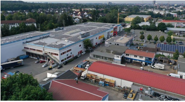
Standort Nürnberg: Solaranlage mit überdurchschnittlichem Stromertrag, errichtet mit dem österreichischen Solarentwickler CCE

gefördert. So werden Verbesserungsvorschläge verschiedenster Art von der Geschäftsführung engagiert aufgenommen, geprüft und gegebenenfalls umgesetzt. Der Identifikationsgrad der Mitarbeiter auch auf der Ebene einfacher Tätigkeiten ist außerordentlich hoch. FIM ist als vorbildlicher Ausbildungsbetrieb ausgezeichnet worden. Dank mehrfacher Vor-Ort-Sichtungen kann CHECK bestätigen, dass das FIM-Team eine hohe Eigenmotivation bei der täglichen Arbeit praktiziert.