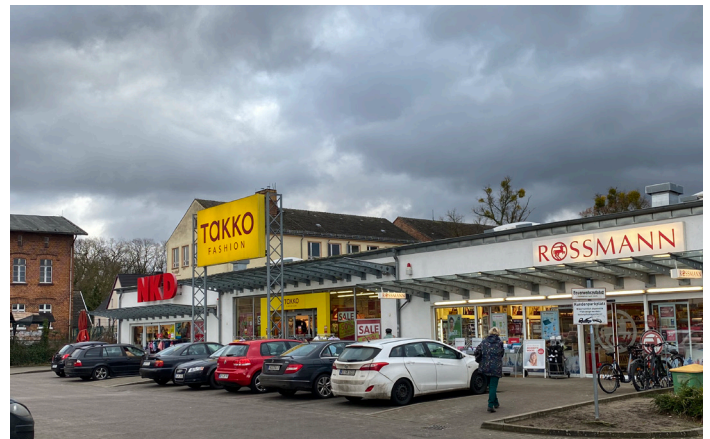
FIM-Standort Torgelow - von Rossmann zu einem attraktiven Kaufpreis erworben

bei den geschäftspolitischen Prioritäten der Mieter kann genau justiert werden, welches Potenzial in welchem Objekt und dessen Standort zu welchem Marktanbieter passen. Dabei hilft der über Jahrzehnte gewachsene Zugang zu den Netzwerken der Topentscheider der Branche. Klassische Fonds sind auf langwierige Prüfprozesse und die Expertise Dritter angewiesen. Das ist bei Ankaufverhandlungen ein Nachteil, bei denen manchmal binnen weniger Tage Entscheidungen getroffen werden müssen. FIM kann dank hoher Entschei-