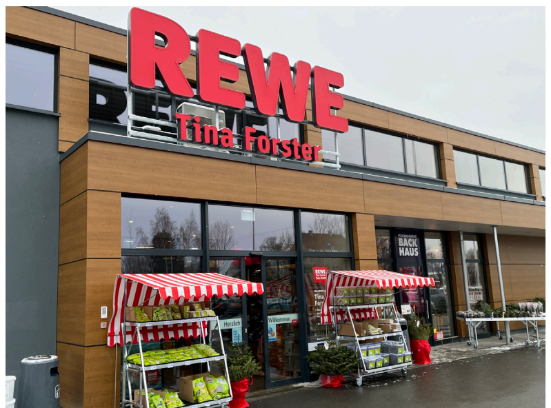
FIM Green Building REWE Markt Münchberg, zu einem attraktiven Faktor verkauft

Zurzeit gehören ca. 100 Grundstücke mit mehr als 500 Mieteinheiten zum FIM-Assetbestand. Diese FIM-Märkte liefern nach nicht umlagefähigen Immobiliennebenkosten einen jährlichen Miet-Netto-Cash-Flow von zurzeit knapp EUR 36 Mio. Mietüberschuss nach Zins und Tilgung knapp EUR 9 Mio. Der Zinssatz des zu bedienenden Fremdkapitals liegt 2022/2023 durchschnittlich bei ca. 3,55 % p.a. (vormals 1,53 %). Zurzeit werden jährlich