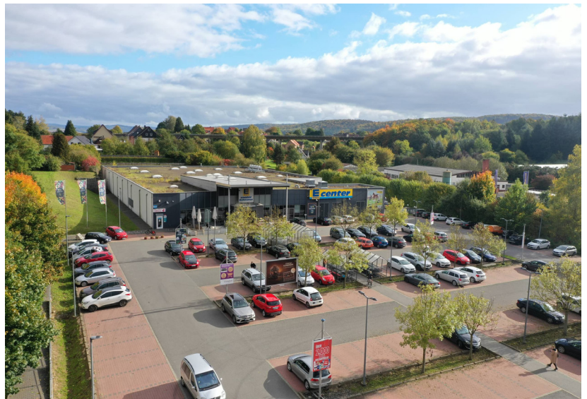
FIM Investition Bad Gandersheim, Mietfläche 3.800 qm

Bis 2004 war der heutige FIM-Gesellschafter bei Kaufland als Geschäftsführer angestellt und hat wesentlich dazu beigetragen, das Immobiliengeschäft im Rahmen des Ankaufs weiterer Filialstandorte zu initiieren und zu strukturieren. Ab 2004 hat er große LEH-Filialisten bei der Strukturierung ihrer Immobilien und Verkaufsflächen beraten. Ab 2008 wurden Lebensmittel- und Einzelhandelsmärkte auf eigene Rechnung erworben, revitalisiert und möglichst lange oder dauerhaft im Eigenbestand gehalten. Das hat dazu geführt,